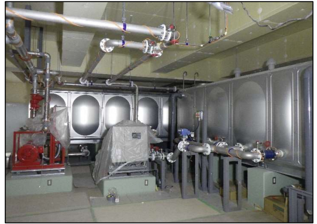
《消火栓用水槽、受水槽》

ガスエンジンでコンプレッサーを駆動し、高効率の冷暖房を実現する空調システムです。屋上に設置しています。