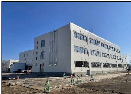
※外壁の塗装が全面完了済みです。優しい色合いに仕上がりました👍