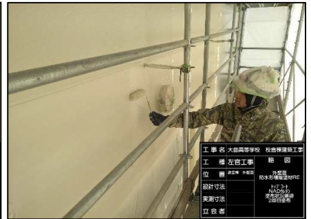
③上塗りの2回目。塗装職人さんが丁寧に塗って完了です！