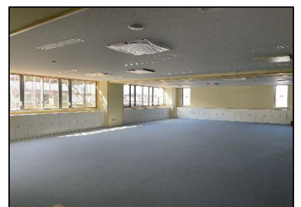
※左から順に普通教室・図書室・職員室の内装仕上げ状況です。天井床壁完了し、家具の取付も進めています。