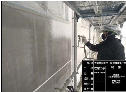
①主材を吹付けます。ゆず肌状の模様を形成します。