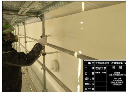
②上塗りの1回目。スプレーガンで均一に吹き付けます。