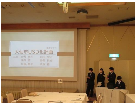
大仙市 USD 計画（3班）