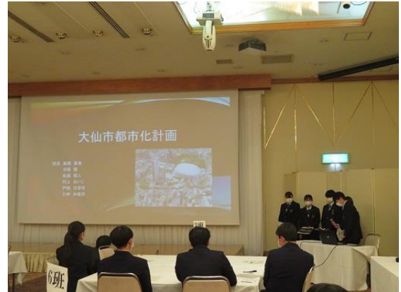
大仙市都市化計画（2班）