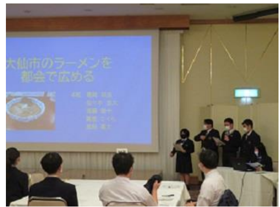
大仙市のラーメンを都会で広める（4班）