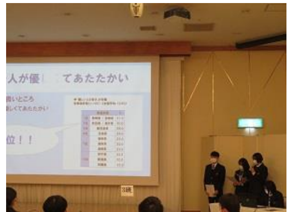
大仙市のおばあちゃんのアイドルグループ を作る！（6班）