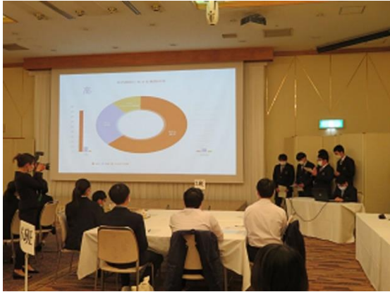
大仙市を活性化させるためには（1班）